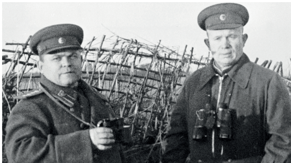
Командующий Воронежским фронтом Генерал Н. Ватутин и член Военного совета фронта генерал-лейтенант Н.Хрущев в преддверии Курской битвы

19 мая Военный совет Юго-Западного фрон-