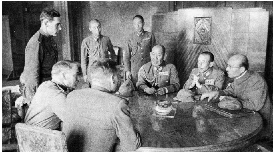
Окончание. Начало в №№ 36, 37.1

На Курильских островах у японцев были значительные силы, части 27-й армии: 91-я пехотная дивизия (на о. Шумшу, Парамушир, Онкотан), 89-я пехотная дивизия (на о. Итуруп, Кунашир, Малой Курильской гряде), подразделения 11-го танкового полка (Шумшу, Парамушир), 31-й полк ПВО (Шумшу), 41-й отдельный смешанный полк (на о. Матуа), 129-я отдельная пехотная бригада (на о. Уруп). Всего более 80 тыс. солдат и офицеров. Северной группой командовал генерал-лейтенант Цуцуми Фусаки.