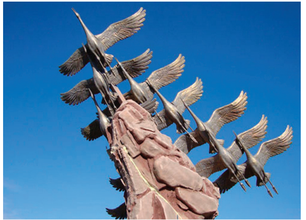
Памятник воинам, погибшим в Великой Отечественной войне

Парадокс ситуации, что почему-то Расул Гамзатов спрашивал в министерстве культуры Осетии разрешения на то, чтобы вместо «гусей» написать «журавли», но в стихотворении явно пишет о погибших аварцах, не смутил автора этой версии, также как и то, что теряется и сама логика, получается, что скульптор создал памятник с летящими гусями, и поэт Расул Гамзатов, и министерство культуры Осетии