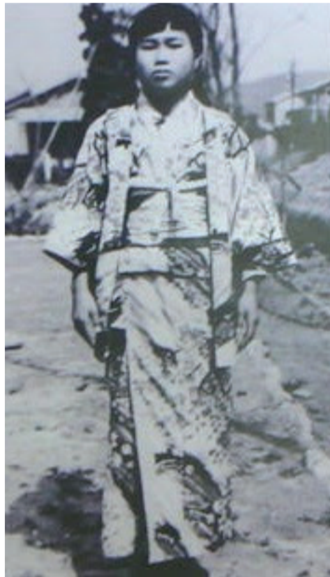
Садако Сасаки в марте 1955 года

братьях, о девяноста тысячах погибших дагестанцев, о двадцати миллионах (а теперь выясняется, что их значительно больше), не вернувшихся с войны, о погибшей девочке из Освенцима и ее маленькой кукле... О многом думал, но мысли возвращались к белым журавлям».