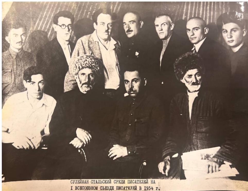
СУЛЕЙМАН СТАЛЬСКИЙ СРЕДИ ПИСАТЕЛЕЙ НА I ВСЕСОЮЗНОМ СЪЕЗДЕ ПИСАТЕЛЕЙ В 1934 г.

Советское время «сделало» Стальского подлинным поэтом для народа. В этот же период многочисленные издания захотели печатать именно стихи, написанные рукой дагестанца. В 1927 году в Москве вышел «Сборник лезгинских поэтов», в котором работы Сулеймана Стальского заняли почетное место. Восторженные оценки критиков и признание читателей привели к тому, что Горький назвал своего коллегу «Гомером двадцатого века».