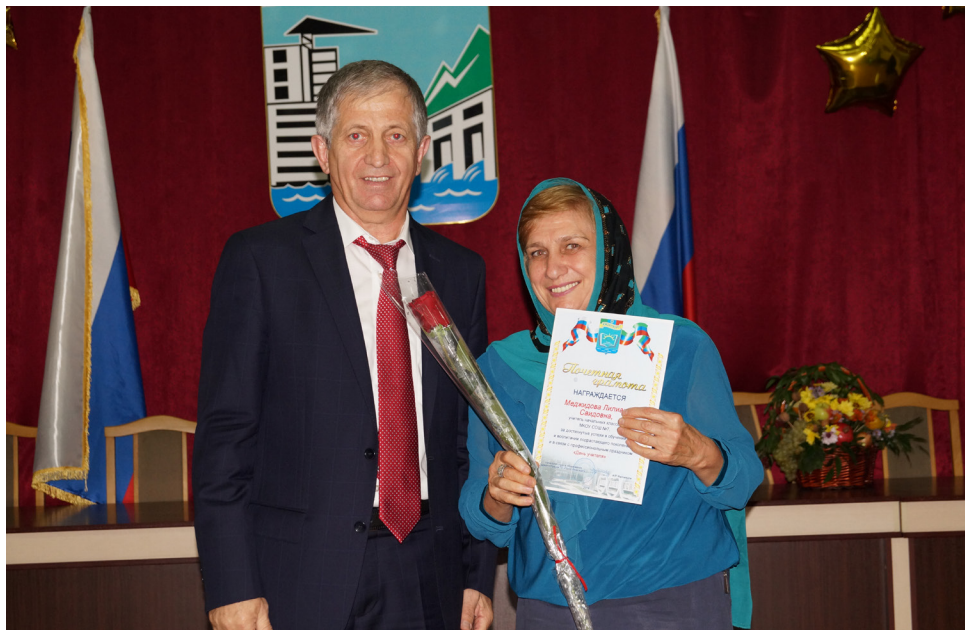
Окончание. Начало на стр. 1.

Отметим, что в рамках праздничного мероприятия в фойе мэрии Кизилорта была развернута городская выставка – конкурс «Осенний букет», посвященный Дню учителя. На выставке были представлены в большом ассортименте поделки, сделанные руками детей и старших наставников, букеты и композиции из искусственных цветов и высушенных растений, своеобразные декоративные панно и многое другое. Победители и призеры ежегодного конкурса-смотря между городскими школами, организованного по инициативе местного отдела образования, будут отмечены грамотами.