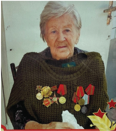
Минуло почти 78 лет с того дня, когда закончилась Великая Отечественная война.

Драматической страницей вошла она в историю нашей страны, причинила народу горе, от которого скорбят сердца миллионов людей. Мы вспоминаем войну с чувством гордости за свой народ и должны рассказать молодому поколению о тех, кто героически защищал нашу страну.